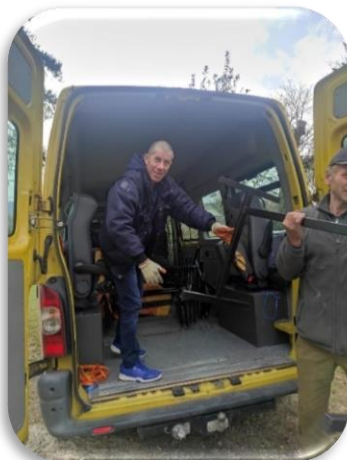
Notre mobilier scolaire est arrivé en Ukraine